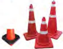
ยางเพิ่มน้ำหนักกรวย