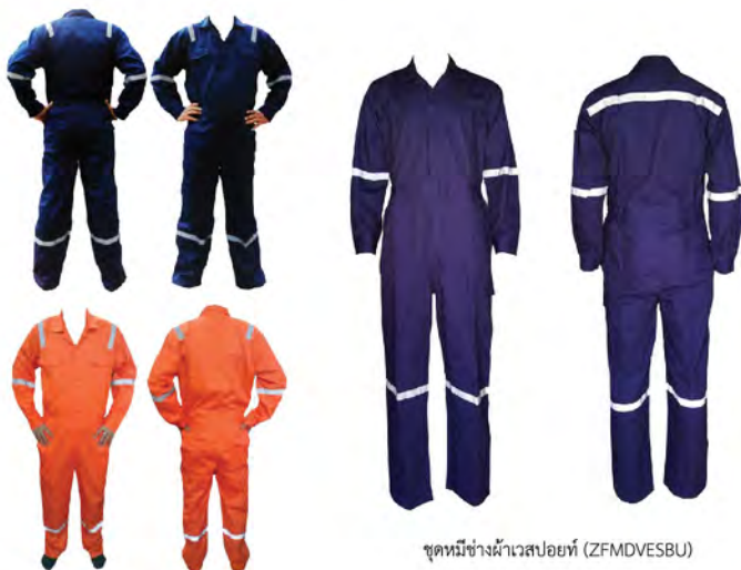
ชุดหมี่ช่างผ้าเวสปอยท์ (ZFMDVESBU)