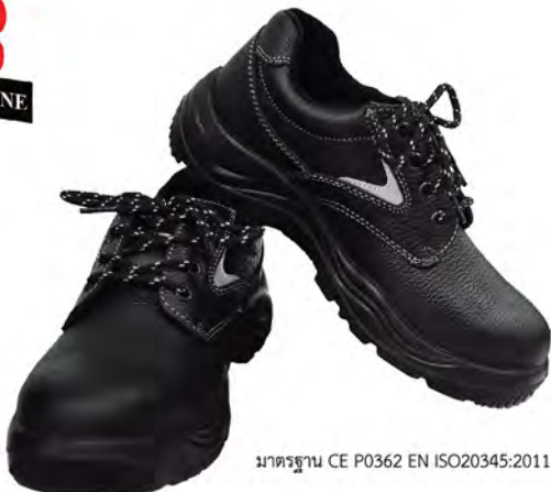
มาตรฐาน CE P0362 EN ISO20345:2011 S1