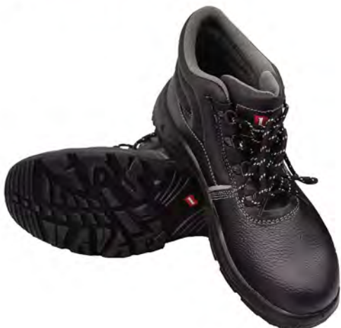
มาตรฐาน CE P0362 EN ISO20345:2011 S3